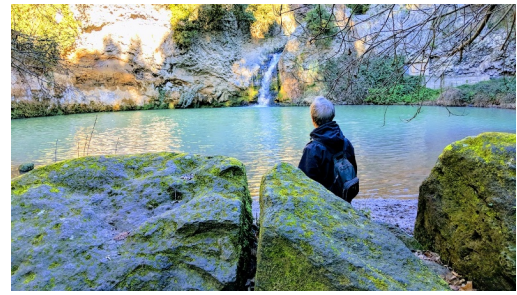
Cascata di Braccio di Mare