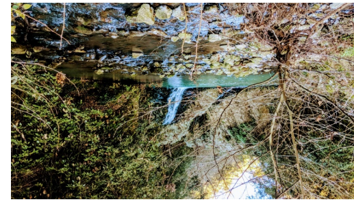
Cascata dell'Arenile