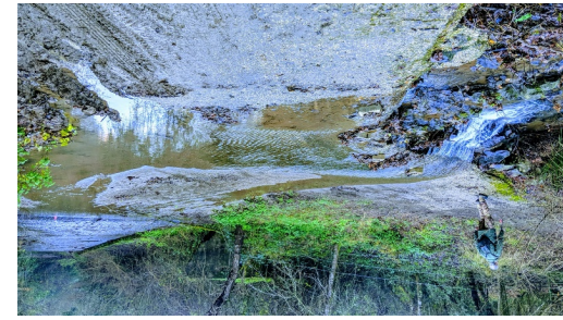
Guado delle antiche Ferriere