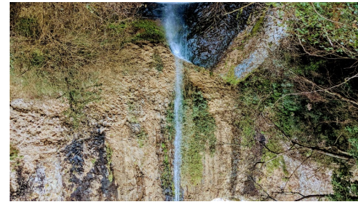
Cascata del Vachello