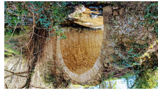
Ponte degli Austraci