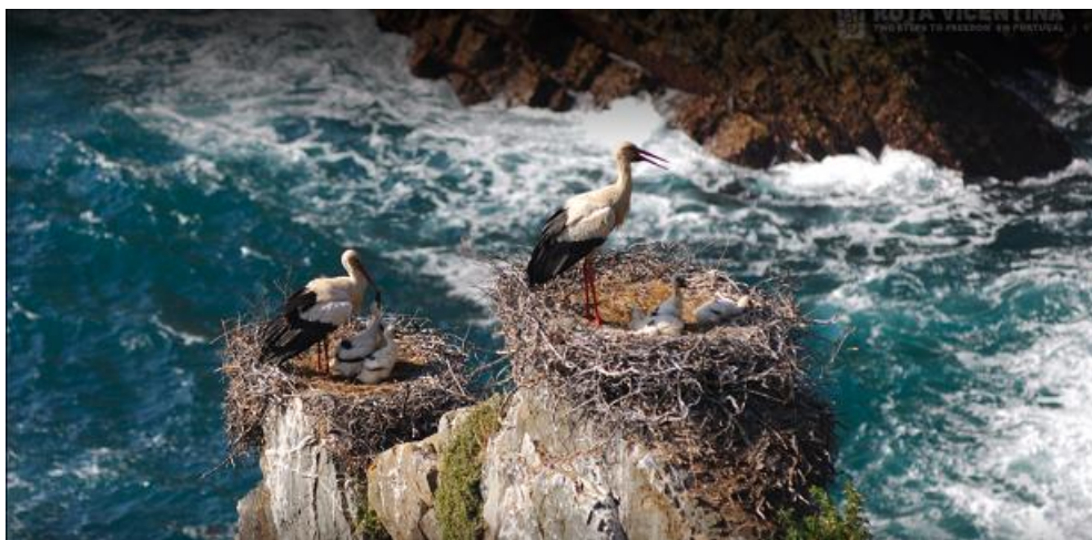
Cicogne a Cabo Sardao

Il cammino più bello del Portogallo: in Alentejo e Algarve!